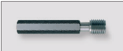
Gewinde-Prüfdorne für neue feste Gewinde-Gutlehrhinge und Gewinde-Ausschusslehrhinge

Thread Plug Gauges for checking new Go Ring Gauges and NoGo Ring Gauges